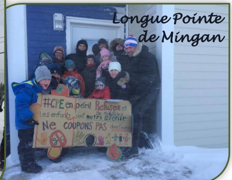
Longue Pointe de Mingan