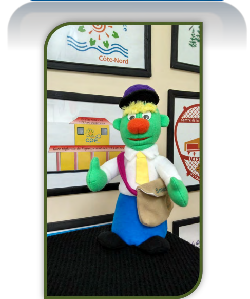
Table des gestionnaires